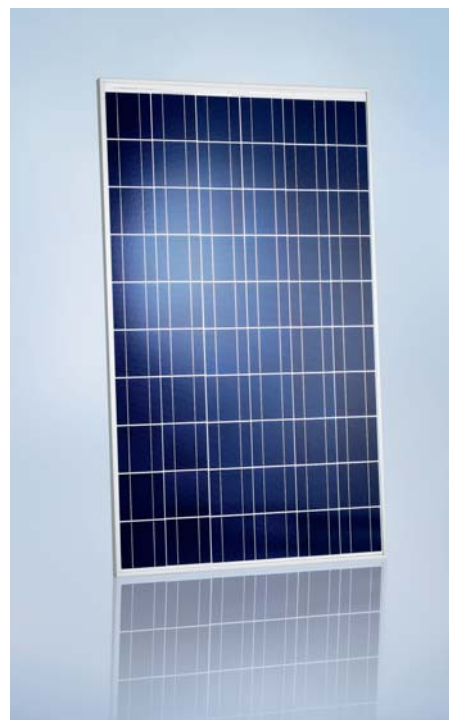
SCHOTT POLY™ 217/220/225/230